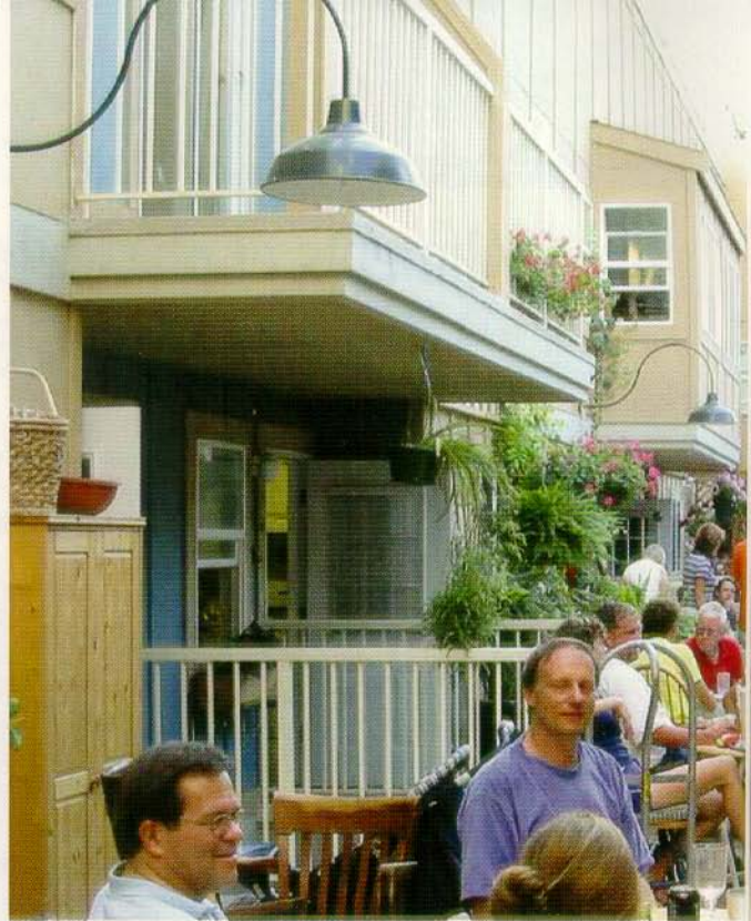
Jour de déménagement bien spécial sous une toiture de verre. Ambiance festive à WindSong CoHousing Community, à Langley près de Vancouver, en Colombie-Britannique.

muns : une grande cuisine, une grande salle à manger, un salon, une buanderie, une salle de courrier, une salle de jeux pour les enfants, une ou plusieurs chambres d'invités